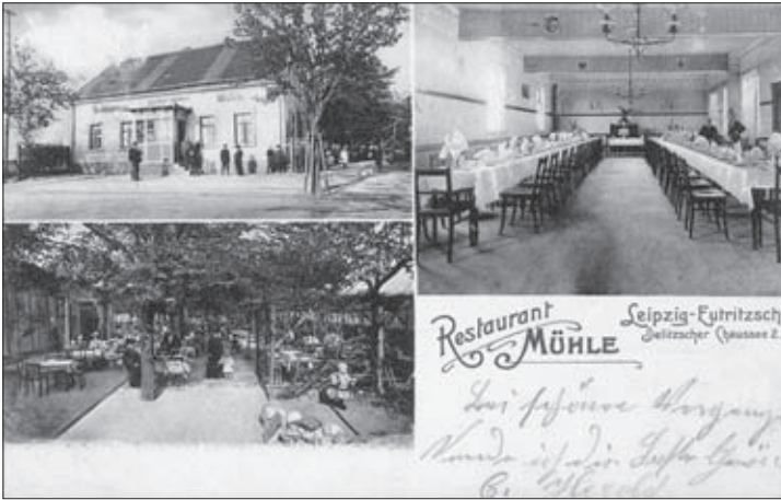
Ansichtspostkarte mit neuem Saal und Kolonnaden, 1907