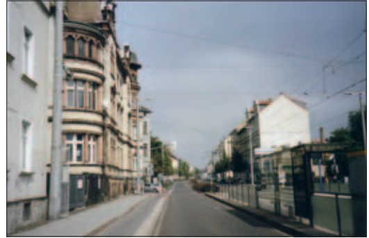
Die Delitzscher Straße heute

Gebäude mit den Hausnummern 24, 26, 26a und 28. Lückenschließung und Rekonstruktion von Gebäuden in der Wilhelminenstraße nach 1990 werben das Wohnumfeld heute auf. Durch die vor allem im Bereich zur Delitzscher Straße neu angepflanzten Linden wird die Trostlosigkeit des verwilderten unbebauten Areals etwas gemildert.