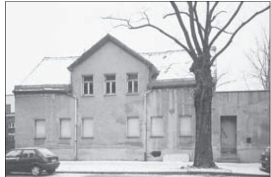
Bauzustand im Februar 2003