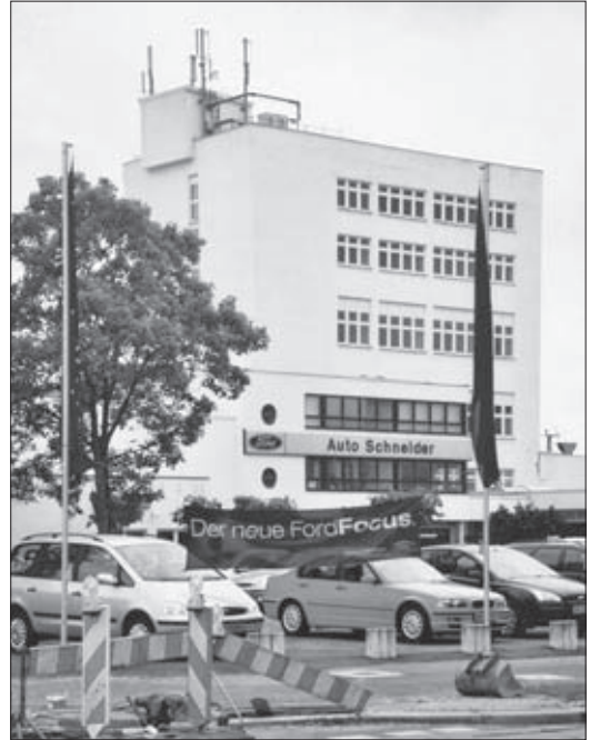
Heutige Ansicht der damaligen Katzbachstraße (seit 1950 Haferkornstraße), Ecke Theresienstraße