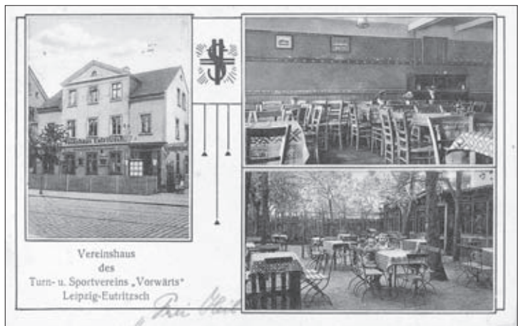
Postkarte des Turn- und Sportvereins „Vorwärts“ aus den 1920er Jahren