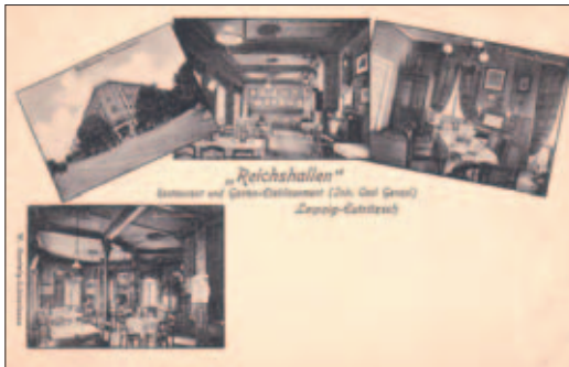
Das Restaurant „Reichshallen“ an der Ecke Delitzscher/Wilhelminenstraße