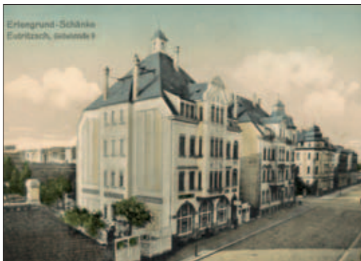
Postkarte zur „Erlengrundschänke“, um 1920

Seit dem 30. Dezember 1897 gibt es die Geibelstraße. Sie wurde nach dem Dichter und Übersetzer Emanuel von Geibel benannt, geboren am 17. Oktober 1815 in Lübeck und dort am 6. April 1884 gestorben.