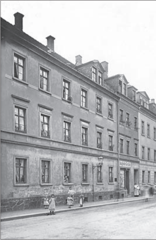
Die Görlitzer Straße 4, um 1908