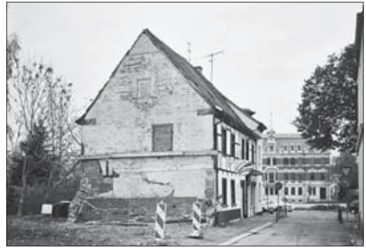
Die Seitengasse 6 nach dem Abbruch der Gebäude 4 und 5, 2003