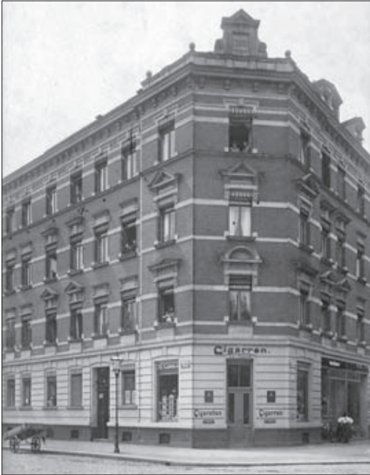
Die Katzbachstraße 21, Ecke Theresienstraße, um 1909