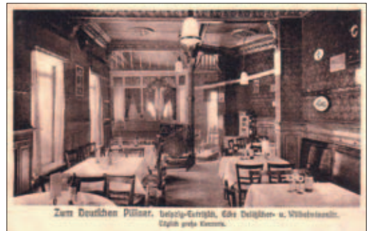
„Zum Deutschen Pilsner“, 1920er Jahre