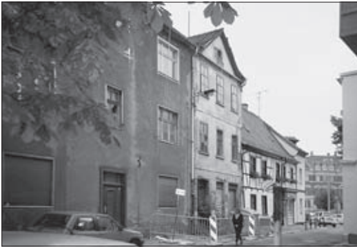
Die Seitengasse 4, 5 und 6, 2000