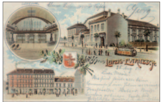
Die neue Turnhalle um 1900