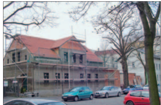
Stand Umbau März 2004

Es entsteht eine Dreibahnenanlage für Bowling, eine Sportsbar und ein wunderschönes Restaurant mit Terrasse. Die Eröffnung soll im September dieses Jahres sein.