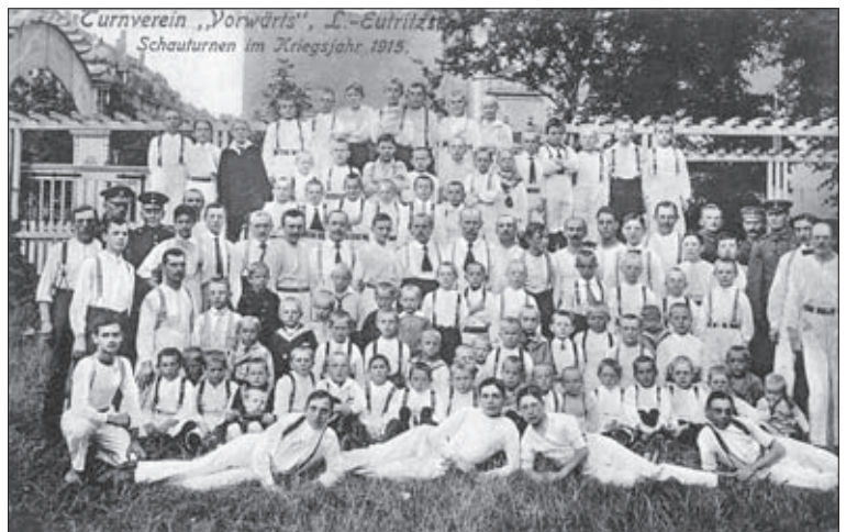
Mitglieder des Eutritzscher Turnvereins „Vorwärts“ nutzten den Saal als Übungsstätte, 1915

stillschweigende Abbruch des Anwesens. Der geplante und propagierte Neubau einer Mühlen-Csarda („Boardinghouse“ mit Appartements, Ladengeschäften und Restaurant/Biergarten) kam nicht zur Ausführung. Heute zeugen noch einige Linden und Kastanien am Rande des Parkplatzes vom Hornbach-Baumarkt bzw. in Höhe der gleichnamigen Straßenbahnhaltestelle vom Standort der ehemaligen Gaststätte „Zur Mühle“.