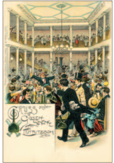
Der Tanzsaal der Eutritzscher Gosen-schänke um 1900, abgebrochen 1959

Medien haben die Menschen in ihre Wohnzimmer verbannt und die verbliebenen bzw. neu entstandenen Eutritzscher Gaststätten kämpfen ums Überleben. Hinzu kommt, dass trotz vielfältiger Aktivitäten der Gastwirte das wirtschaftlich bedingte schmale Budget vieler Bürger Restaurantbesuche nur im bescheidenen Umfang erlaubt.