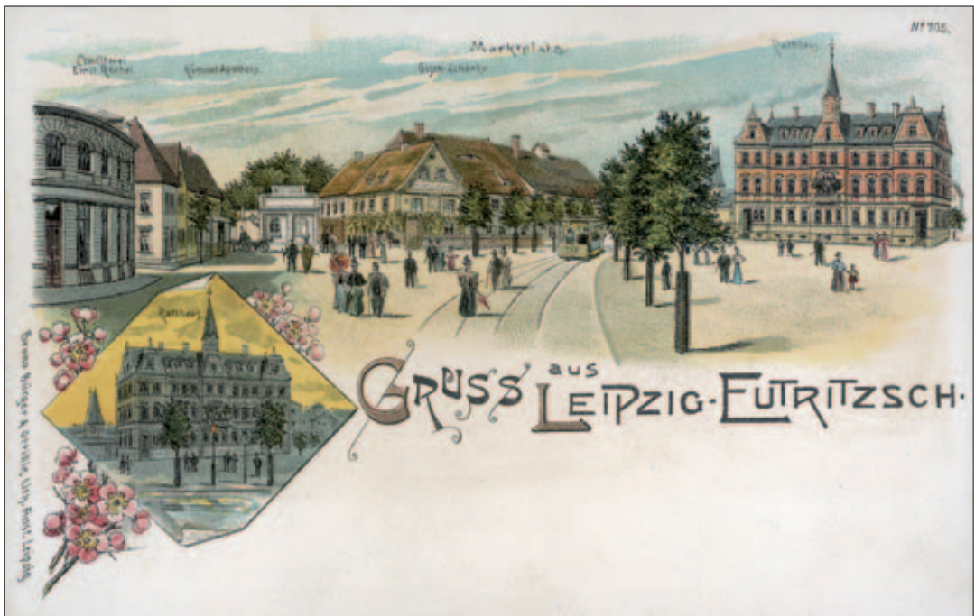
Eutritzscher Markt mit Café Röthel (links), Gosenschänke (Mitte) und Rathaus im Jahre 1898