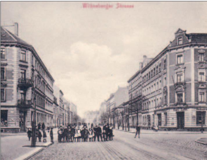
Die Wittenberger Straße, um 1910