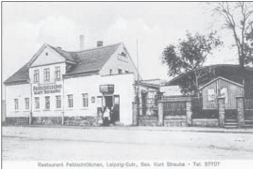
Ansicht des Feldschlösschens um 1925

Seit gut einem Jahr befindet sich das ehemalige Restaurant „Feldschlösschen“, Schönefelder Straße 4, seit den 1940er Jahren auch „Fettbemme“ genannt, im umfassenden Umbau. Vorangegangen war der Kauf des Objektes durch die Familie Krüger (Café Krüger) vom Bundesvermögensamt. Vor den vielfältigen baulichen Veränderungen musste das Gebäude zuerst vom Keller bis zum Boden von Unmengen von Müll befreit werden. Der verrottete „Tatra“ und mehr als tausend leere Flaschen im Außengelände bereiteten weitere Mühe. Der Bauherr hatte es zunächst mit Auflagen des Denkmalschutzes zu tun, die dann später aufgrund der geringen Restsubstanz des ursprünglichen Gebäudes zurückgenommen wurden.