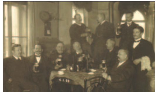
Im Restaurant „Reichshallen“

Der II. Weltkrieg hinterlies auch in Eutritzsch seine Spuren. So auch nördlich der ehemaligen Petzscher Mark. Am Abzweig der Wilhelminenstraße von der Delitzscher Straße wurden, wie das Haus mit dem einstigen Restaurant „Reichshallen“, viele Häuser Opfer der Bomben. Die Wilhelminenstraße beginnt heute auf der linken Seite mit Nummer 7 und auf der rechten Seite mit Nummer 8. Auch die Delitzscher Straße verlor hier vier