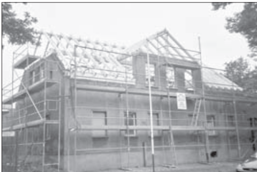
Stand Umbau im Oktober 2003