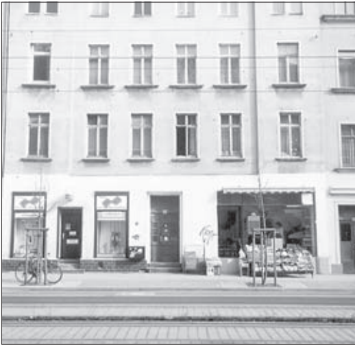
Die Delitzscher Straße 42 mit geöffneten Läden 1997