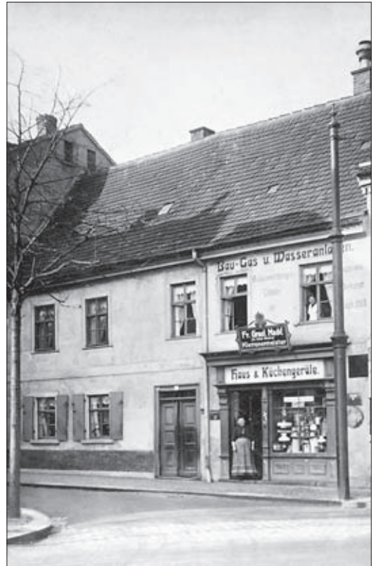
Die Seitengasse 6, 1914