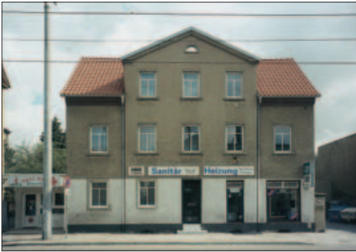
Das Gebäude heute mit der Fa. Petzold Sanitär und Heizung