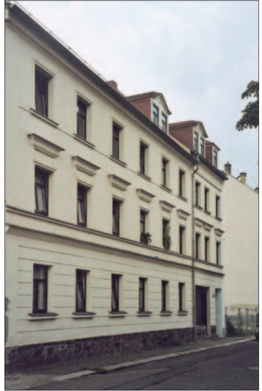
Die Görlitzer Straße 4, im Jahre 2004