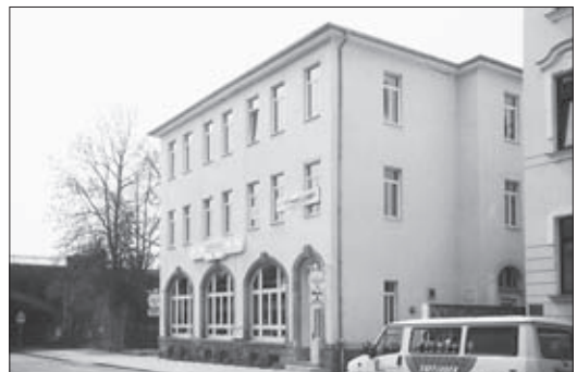
Ansicht des Hauses mit der Gaststätte „Rhodos“, 1997