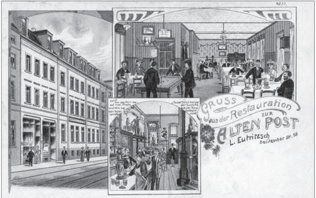
Historische Postkarte, um 1910

warenhandlung Hermann Glahe. Das Gebäude erfuhr eine Erweiterung, indem die Fläche nach Süden hin bis zur Delitzscher Straße 63 geschlossen wurde und eine 3. Etage mit Mansardenwohnungen entstand. Die ehemaligen Eingänge zum Kolonialwarengeschäft und zum Postamt bzw. zur spätern Gaststätte wurden zugesetzt und an ihre Stelle traten Fenster. Im Anbau entstanden neue Zugänge und Räumlichkeiten, wie wir sie noch heute vorfinden.