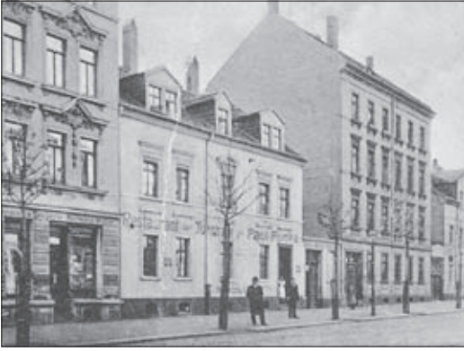
Das „Restaurant zur Turnhalle“ von Paul Funke