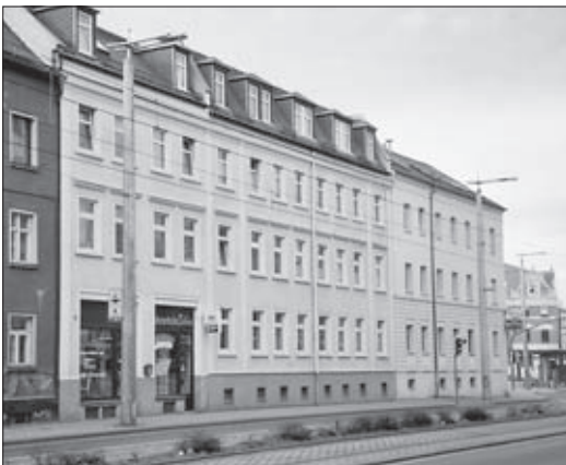
Die Delitzscher Straße 65, 2005: Deutlich ist der Anbau, der das Haus asymmetrisch werden lässt, im Bereich der zwei Schaufenster zu erkennen