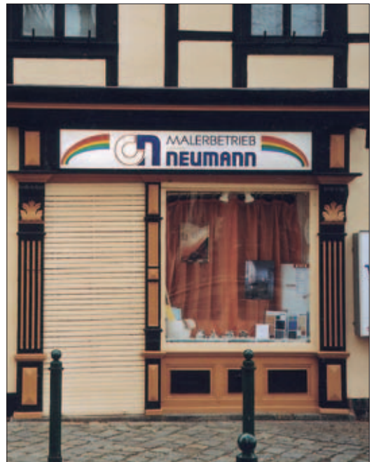
Die Seitengasse 6, heute