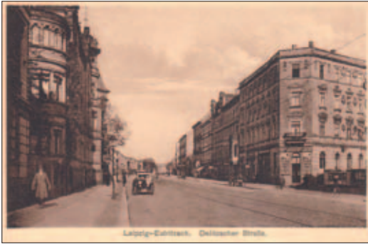
Die Delitzscher Straße/Wilhelminenstraße früher