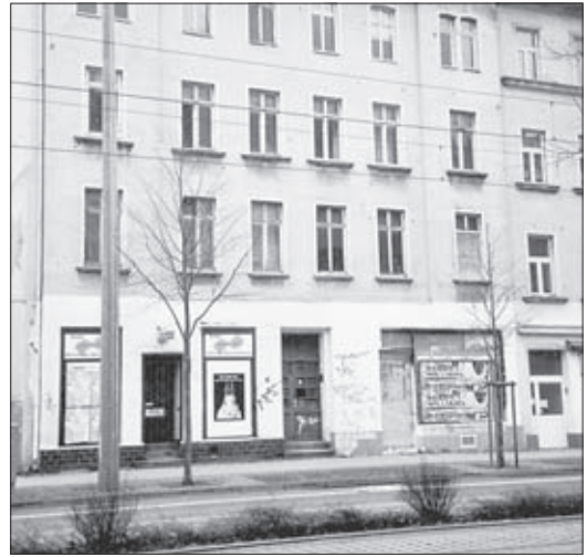
Die Delitzscher Straße 42 heute

Über Leserzuschriften zur Geschichte der Delitzscher Straße 42 freuen wir uns sehr, Weiter suchen wir Erinnerungen der Eutritzscher an die historischen Eutritzscher Gaststätten – Büchner, Klavierschänke, Lindners Ruhe und Stierbucky.